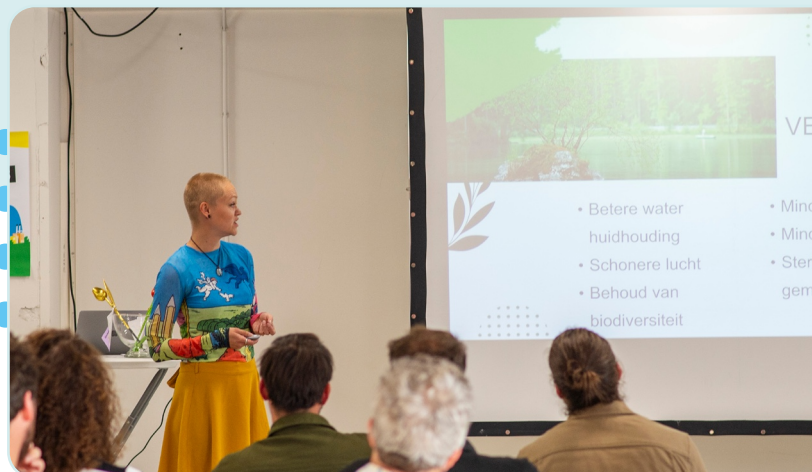
Pitch van de Buurtvergroeners

Door middel van buurtvergroeningsacties willen ze het verlies van biodiversiteit en hittestress in Nijmegen tegengaan en waterberging en sociale inclusiviteit bevorderen. Denk aan tegels wippen, guerilla gardening, tiny forests en plantenbiebs. Tijdens het pitch event stemde het publiek op hun favoriete impact project. De Buurtvergroeners kwamen op de tweede plek met 30% van de stemmen en ontvingen daarmee €1500 euro om Nijmegen nog groener en leefbaarder te maken. Tot nu toe hebben zeven oud-Futureproofers een aanvraag gedaan en funding gekregen om nog meer impact te maken met hun sociale of duurzame project of startup!